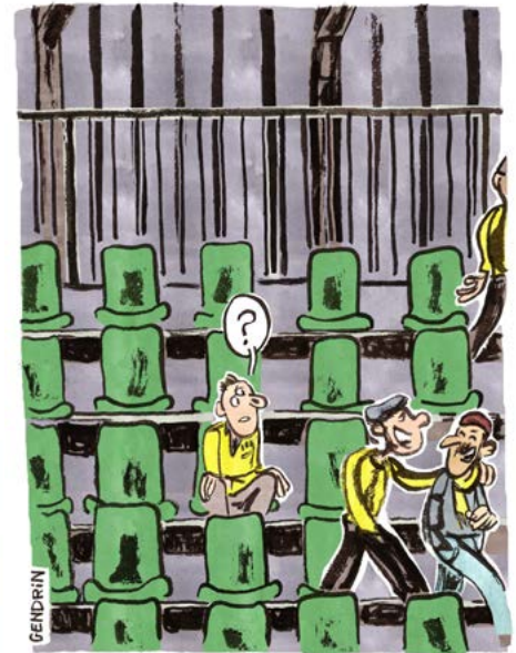
Illustrations des capsules sonores

«Les témoignages récoltés dans le Cœur de Pays Haut sont des petites histoires qui nous font accéder à l'histoire du territoire, à une dynamique qui n'existe plus aujourd'hui.»