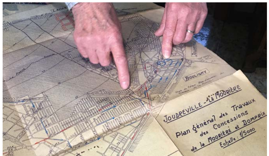
Exploitation du territoire

une représentation complète du récit. Nous avons également travaillé sur les récits que j'ai moi-même collectés sur le territoire. C'est un territoire que les ados connaissent peu car ils fréquentent surtout les grandes villes. Ils ont découvert un peu de l'Histoire agricole et de l'Histoire minière du Cœur de Pays Haut à travers ces récits.