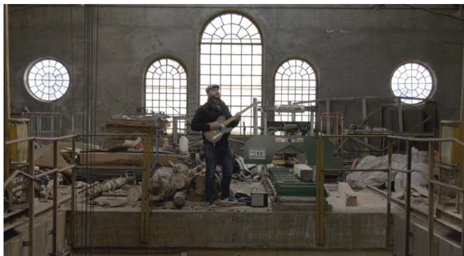
Rencontre des lieux

300 ans en lien avec l'histoire de l'immigration, est un conglomérat de musiques de différents pays, de différentes cultures. Et la technique de l'enregistrement qui s'est développée en premier aux Etats-Unis a sauvé la musique traditionnelle grecque, irlandaise, etc.