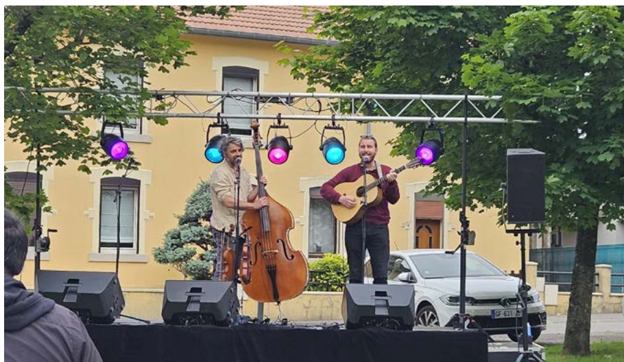
Concert des Awesome Possums