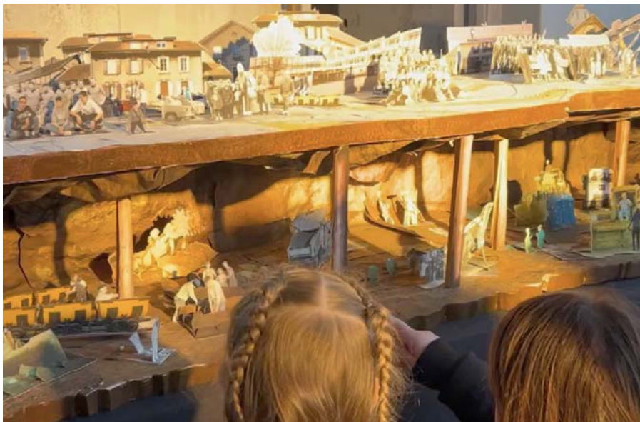
La maquette créée par les élèves en année 1

à découvrir et que c'est un territoire en reconstruction. Et chacun peut prendre part, à son niveau, à sa reconstruction. C'est assez plaisant d'habiter un territoire où l'on a l'impression d'avoir quelque chose à faire.